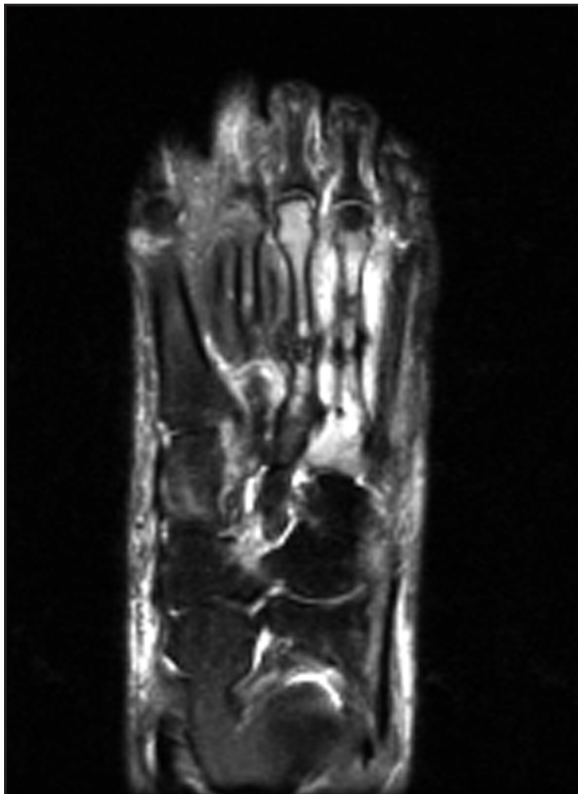
Figura 1. Imagen de la RMN del pie derecho que muestra callo de fractura en 3º y 4º MTT (Caso 1)

Valorando el caso de esta paciente en conjunto, nos planteamos, como factor predisponente para la aparición de fracturas de estrés, la importante alteración de la estática de pies antiálgica que había desarrollado debido al dolor que le producía la severa insuficiencia linfática que padecía.